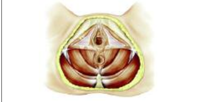
ILLUSTRATION VENLIGST UDLÅNT AF COLOPLAST